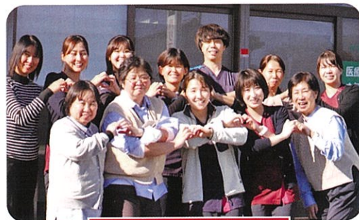
ケアセンターかもがわ