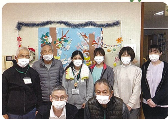
通所リハビリテーション

今年も3事業所が連携し、地域の方々安心して暮らせるまちづくりを、事業と運動を通して支え、組合員・地域の皆様から信頼される事業所として努力してまいりますので、今後とも変わらぬご支援を賜りますように、何卒よろしくお願い申し上げます。