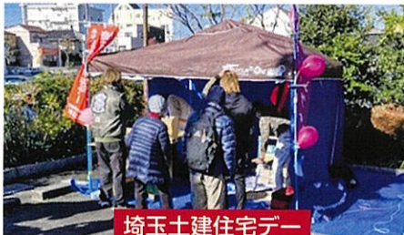
埼玉土建住宅デー

11/23 (土) おおみや診療所とおおみやケアセンターにて、健康まつりを開催しました。今回は埼玉土建住宅デーと合同開催でした。参加者・組合員・職員合わせて約150名が参加しました。加入4件 9,000円、増資30件 68,000円の成果もありました。