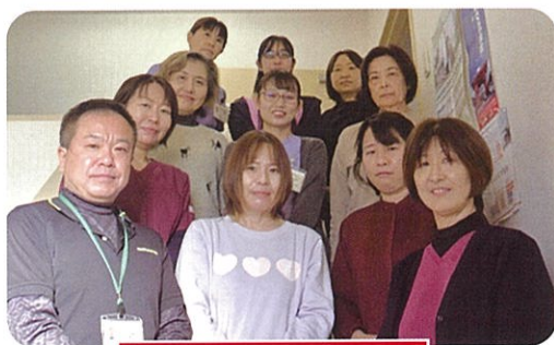
おおみやケアセンター