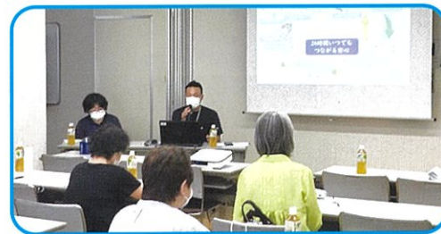
6月13日 大宮西支部 学習会の様子