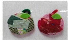
クラブ活動 りんごのマグネット