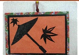
クラフト(傘ともみじ)